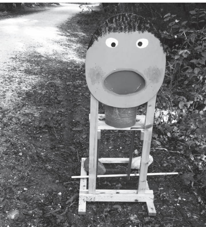
Lieblingsposten der Kinder – Eimerspritze [Holzgesicht]

Kaum hat das neue Schuljahr begonnen, fand am 7. September unser Sporttag statt. Statt die Schulbank zu drücken, hiess es, sich den ganzen Vormittag zu bewegen, indem die 1. – 4. KlässlerInnen in Gruppen verschiedene Posten absolvierten. Die Sonne war den ganzen Vormittag mit von der Partie und begleitete die Kinder auf ihrem Rundweg.